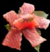
8.50€ Thon rouge