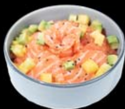
16.50€ Saumon, avocat, mangue