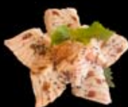
7.90€ Tataki saumon