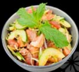
16.50€ Mariné de thon et saumon, poireaux, concombre, menthe, coriandre et mélange de 7 épices