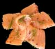
8.90€ Saumon gravlax (mariné aux 5 baies, l'huile d'olive, citron et herbes)