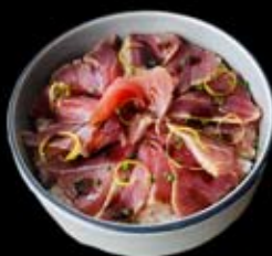
17.50€ Tataki thon, sauce yakitori, ciboulette, zeste de citron