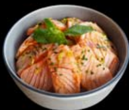
16.50€ Tataki saumon, sauce yakitori, ciboulette, zeste de citron