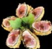
12.90€ Thon crunch (thon rouge enroulé dans feuille algue, tempura et légèrement frit, poudre 7 épices, sauce teriyaki)