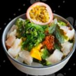
17.50€ Exotique : crevette, mangue, menthe, avocat, coriandre, algues, fruits de la passion, œufs de saumon