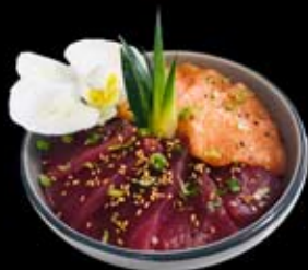
16.50€ Thon, saumon, zeste citron vert, ciboulette